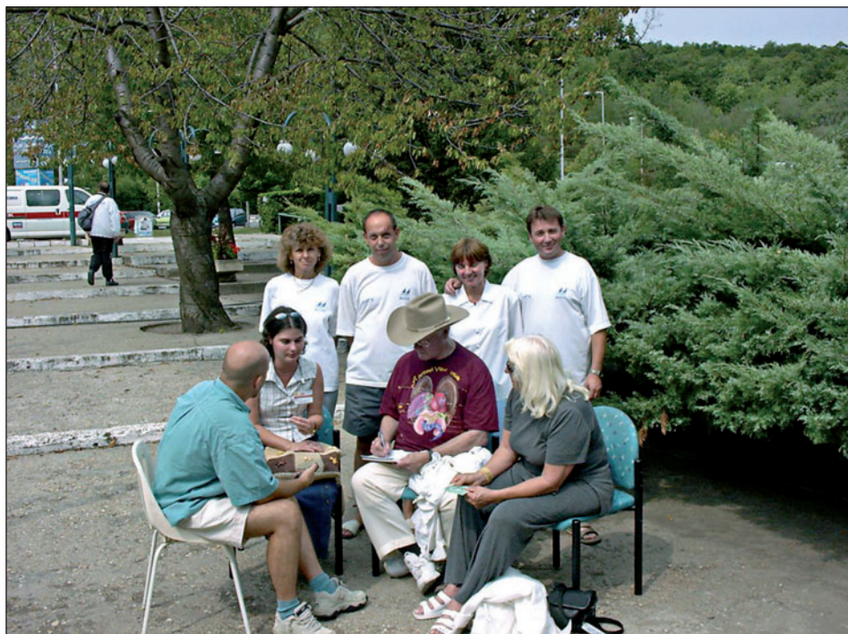
A „dallasi olajmágnás” dedikálja a „dollárokat” az uszoda bejárata előtt

A Nitrokémia 2002. I-III. negyedében két termelő üzletágot (lőpor, NC) és a szennyvízkezelőt – szolgáltató üzletág – működtette. Mivel a társaság működési körébe visszake-