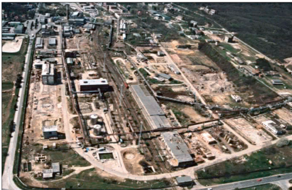
Központi I. telephely

tás-technológia üzemi létesítményeit; a központi I. telephely vegyipari intermedier gyártó üzemeit a nitro-benzoltól a glicinig; az egykor vezér termékcsaládot jelentő acetoklór és propizoklór hatóanyagú gyomirtószer gyártó- és formázó üzemeit; a gyár alapításától folyamatosan működő nitrocellulóz-gyártás üzemi létesítményeit. (A Hunyadi üzem szaghatása miatt a Nitrokémia gyakran „reflektorfénybe” került.)